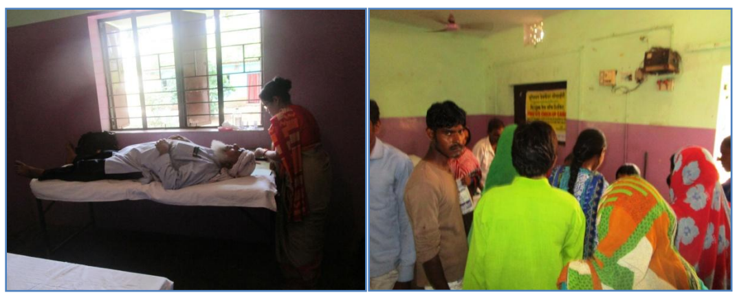
Camp in progress with RSB CSR Team from Jsr present