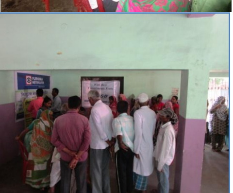
1<sup>st</sup> two rows – single rose flower welcome to under-privileged prelude to camp. Last Row – registration formalities of camp in progress